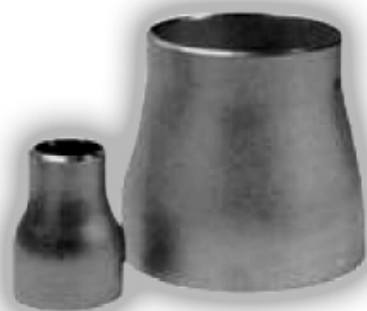
Переходы стальные концентрические ГОСТ 17378-83

Переходы концентрические, тройники, заглушки стальные под приварку